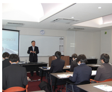
2月26日(水) (株)共立ソリューションズ様 による企業説明会

2026年卒生の就職活動が本格的に始まりました。特に2年課程の学生は、入学後あっという間のスタートです。落ち着いた髪色に戻す在校生が増え、活動への意識が高まってきたように見受けられます。2月は、企業説明会や会社見学、1dayお仕事体験、データセンター見学など、学校と企業様が連携した就活イベントが盛りだくさんの1か月でした。3月以降はさらに選考会が増えるため、今は業界研究や自己分析などの準備に取り組む大切な時期です。イベントだけではなく、学生と就職担当教員との個別面談も実施中。彼らの性格や適性、スキルも踏まえた上で、今後の活動についてアドバイスしています。